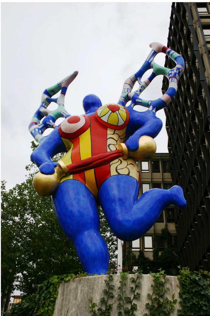
« La Grande Tempérance » à la place Emile Hamilius, 2007