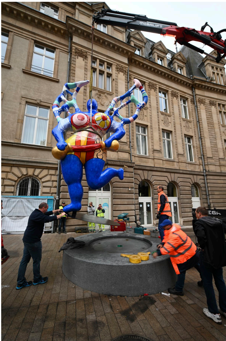
Mise en place de « La Grande Tempérance » au lieu-dit « Um Piquet », le 25 septembre 2019

En deuxième lieu, toutes ces zones traitées préalablement ont été retouchées, c'est à dire qu'il a fallu intégrer parfaitement tous les manques et lacunes en réalisant une retouche chromatique mimétique ce qui a finalement permis de redonner une harmonie esthétique à l'ensemble de l'oeuvre pour les années à venir.