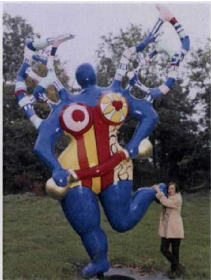
Niki de Saint Phalle posant avec « La Grande Tempérance », 1994

Le vendredi 4 octobre 2019 à 11.30 heures