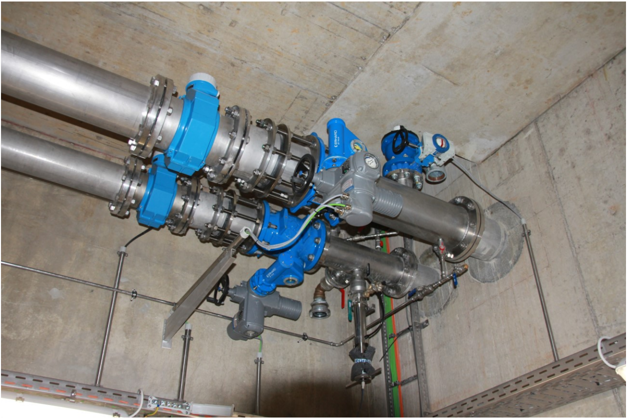
Tuyauterie en acier inoxydable

La construction a été réalisée en béton armé coulé sur place. L'ancienne tuyauterie en fonte ductile a été remplacée par une tuyauterie en acier inoxydable, garantissant la longévité des tubes. Les cuves sont étanchéifiées par l'application d'un revêtement en mortier projeté, sur base de ciment sans additifs organiques.