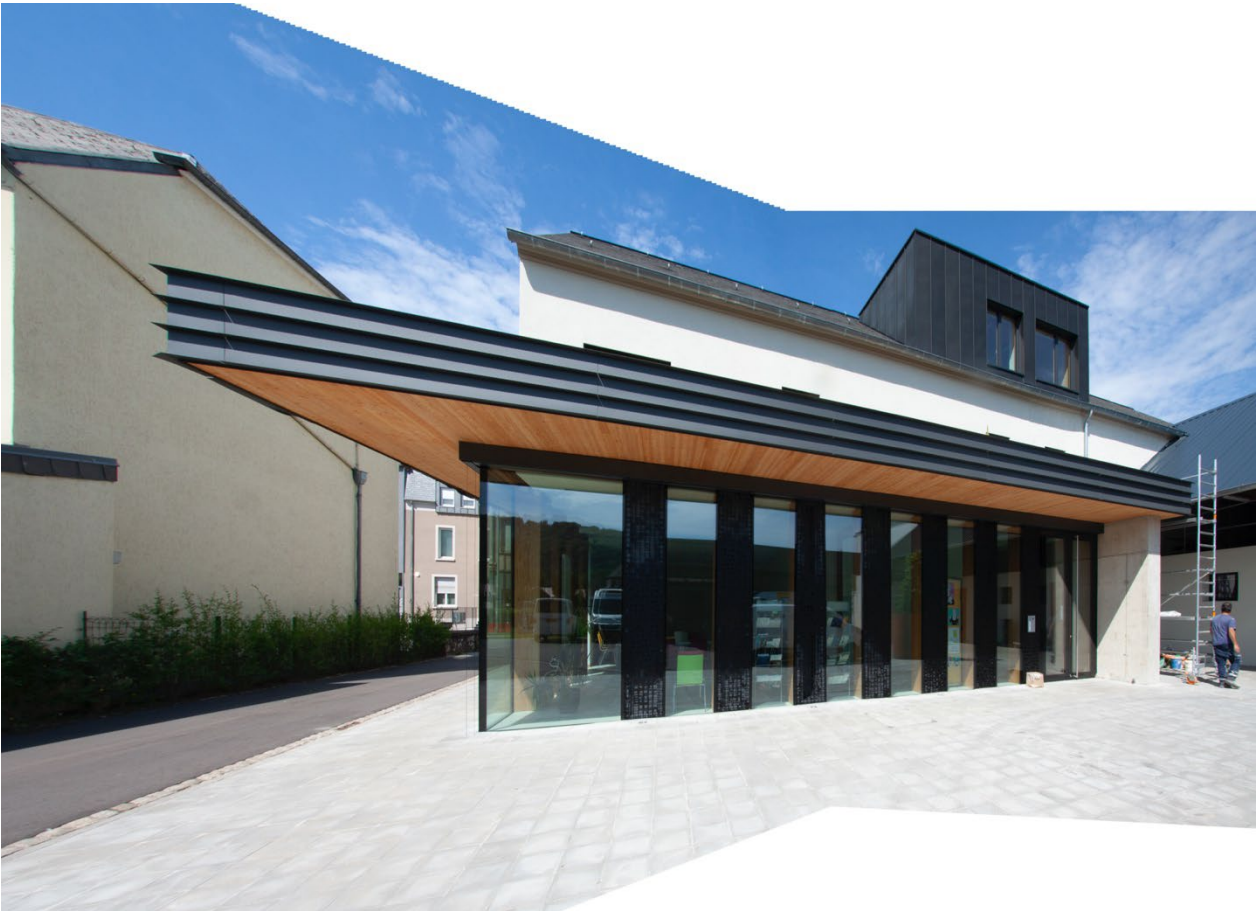
Nouvelle façade arrière avec entrée principale