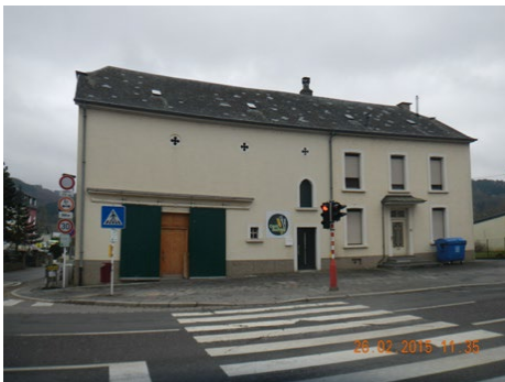
Situation avant travaux

L'aménagement de la cour intérieure se traduit par une augmentation de la surface pavée, l'intégration de bancs servant de mobilier urbain ainsi que l'implantation d'un arbre central dans un bac en béton en partie enterré. S'y ajoute l'installation d'un nouveau raccordement à la canalisation sise rue de Bastogne pour les eaux pluviales. Les toitures existantes en « Eternit » de la maison principale ainsi que de la grange ont été enlevées et un assainissement d'amiante a été réalisé pour la totalité de l'existant.