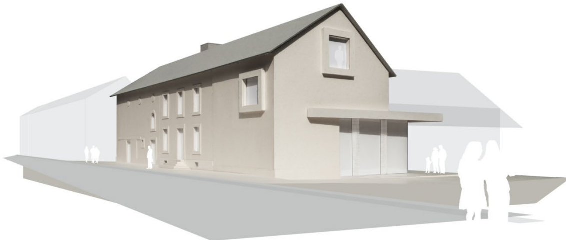
Vue de la rue de Beggen en provenance du centre-ville