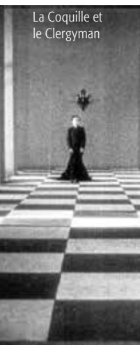
La Coquille et le Clergyman