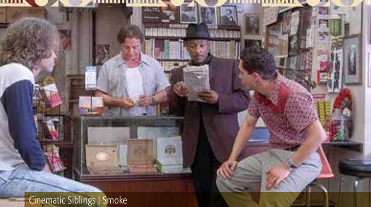
Cinematic Siblings | Smoke