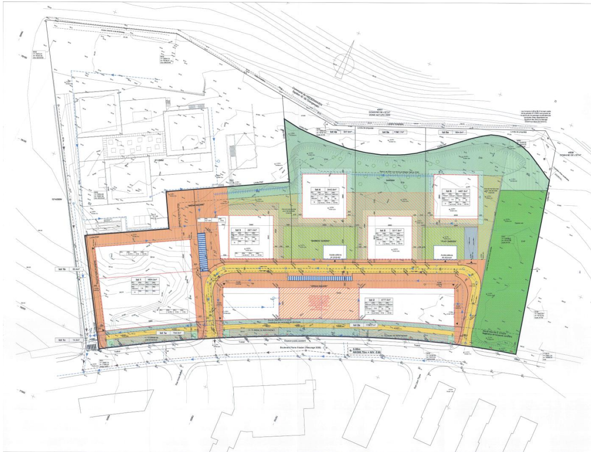
Source : PAP «Domaine Media Park» à Luxembourg, partie graphique – SchemelWirtz